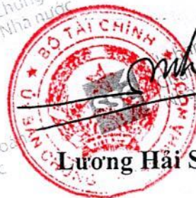
Lương Hải Sinh