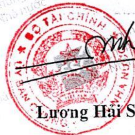
Lương Hải Sinh