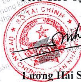
Lương Hải Sinh