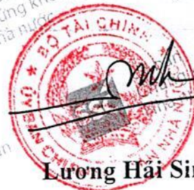
Lương Hải Sinh