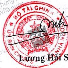
Lương Hải Sinh