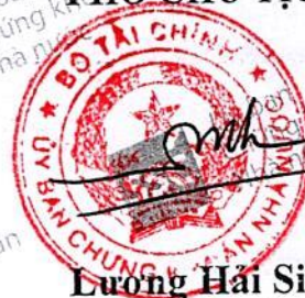
Lương Hải Sinh