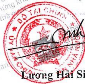
Lương Hải Sinh