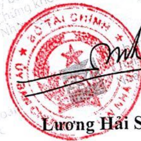
Lương Hải Sinh