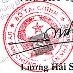
Lương Hải Sinh