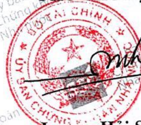
Lương Hải Sinh