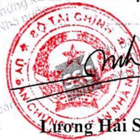
Lương Hải Sinh